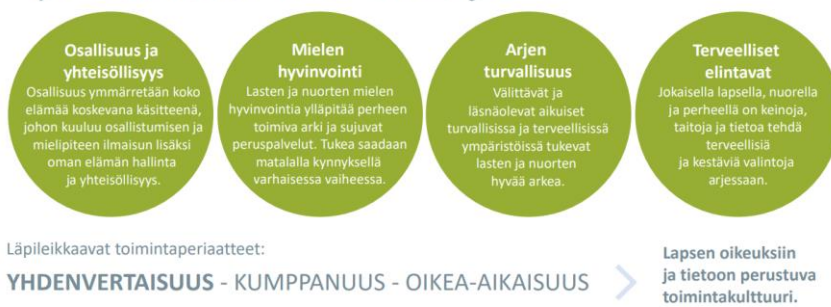
Kuva 2. Lasten ja nuorten hyvinvointisuunnitelmat painopistealueet Lahdessa 2022-2025