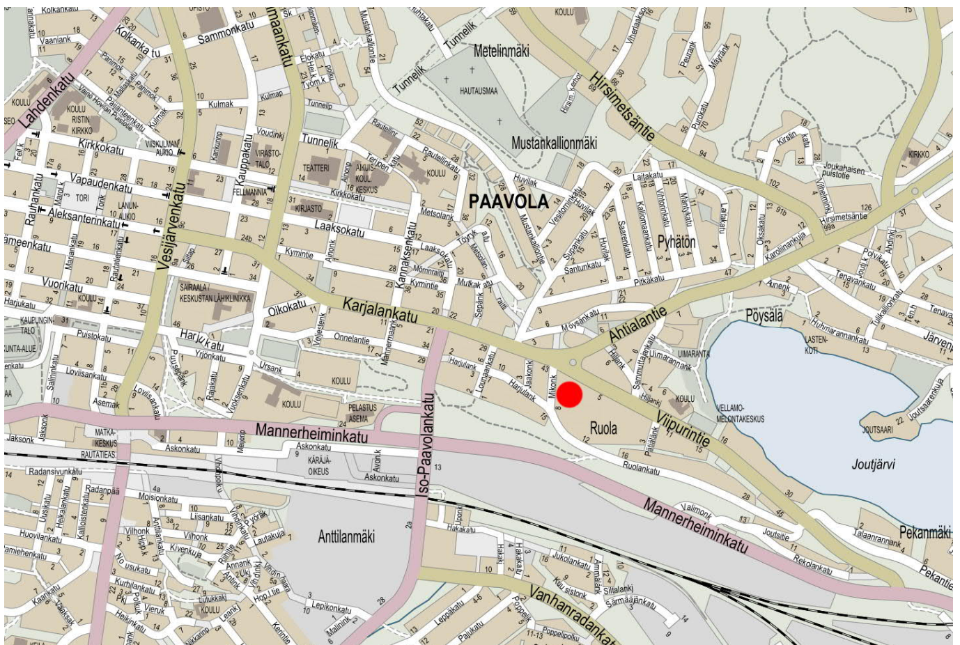
Kuva 1 Kaavamuutosalueen sijainti pohjakartalla

Kaavoitettava alue sijaitsee Lahden keskusta alueella Karjalankadun päässä n. 1,5 kilometriä Lahden torilta itään.