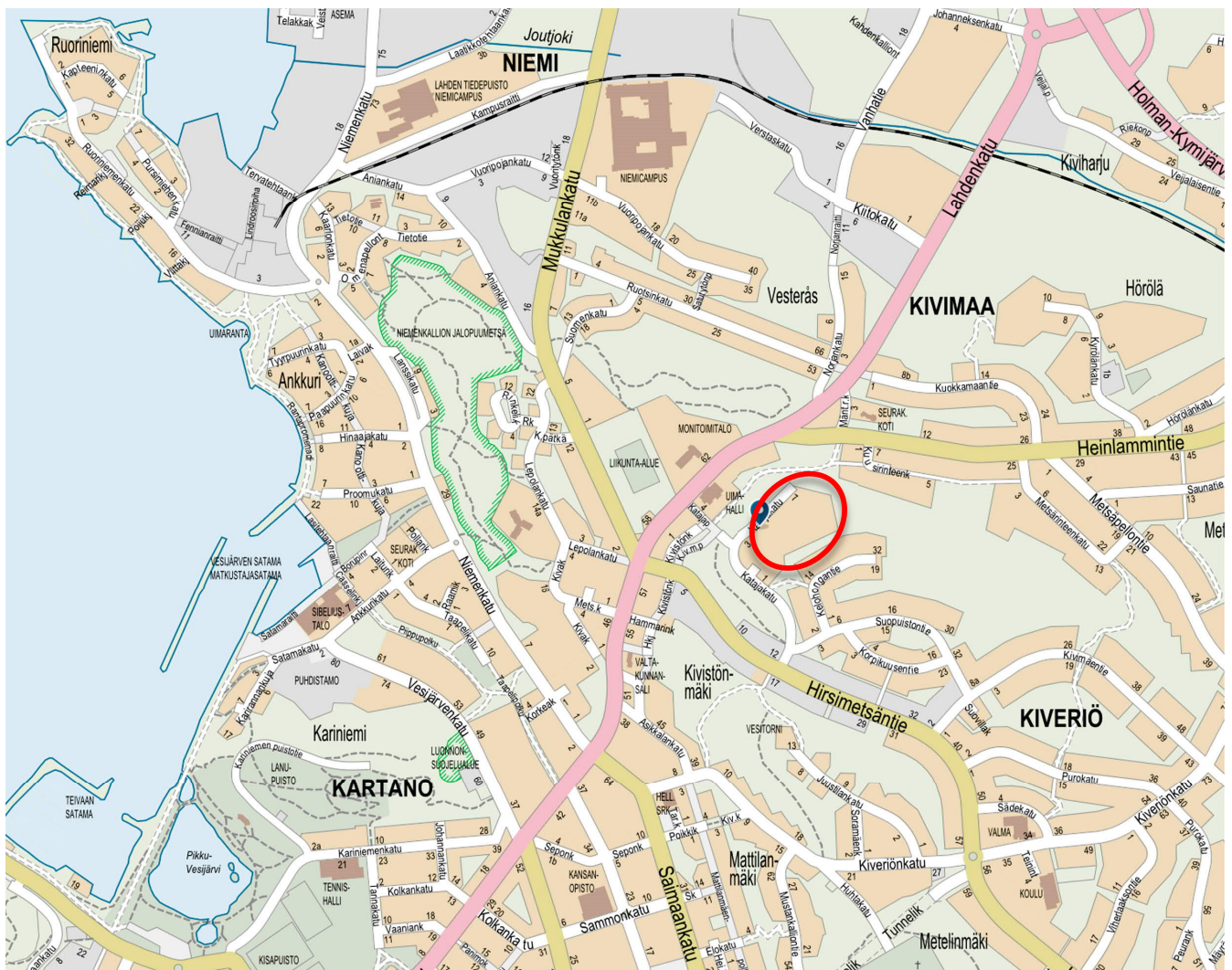
Kuva 1 Kaavamuutosalueen sijainti opaskartalla.

Kaavoitettava alue sijaitsee Kivimaan (6.) kaupunginosassa.