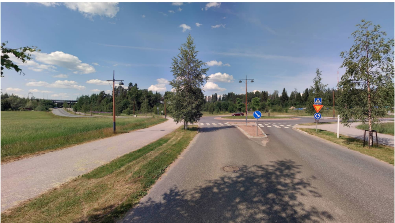
Kuva 2. Näkymä Karistonkadulta Kauppiaankadun kiertoliittymää kohti.

Asemakaavatyöhön A-2872 liittyen on tarkoitus järjestää erillinen aloitusvaiheen viranomaisneuvottelu.