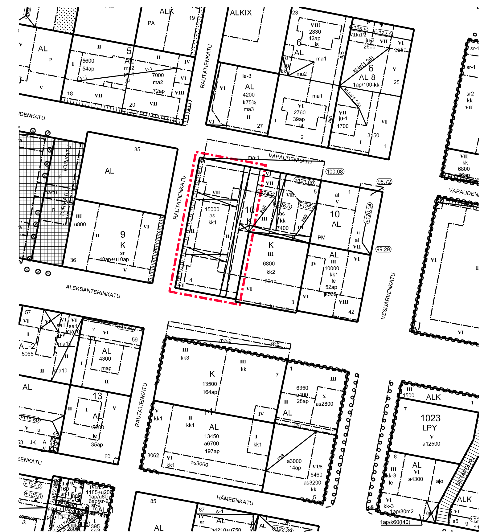
POISTOKARTTA MK 1:1500