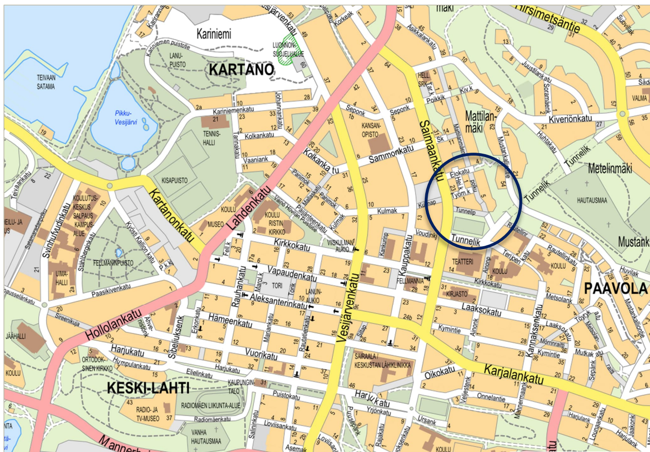
Kuva 1: Kaavakohteen sijainti opaskartalla.

Kaavoitettava alue sijaitsee alle kilometrin etäisyydellä Lahden ydinkeskustasta ja kauppatorilta.