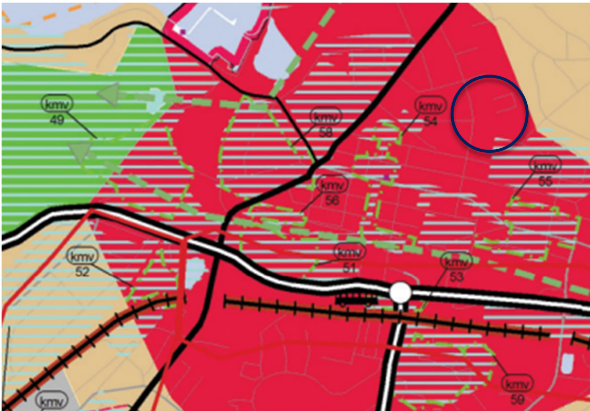
Kuva 2: Ote maakuntakaavasta. Kaavatyökohteen sijainti ilmaistu sinisellä ympyrällä.