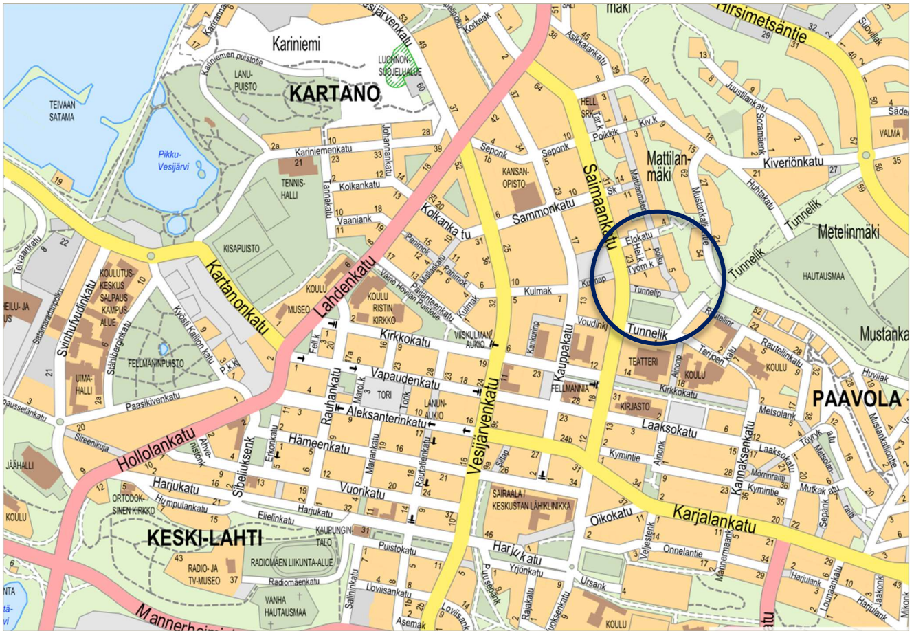
Kuva 1: Kaavakohteen sijainti opaskartalla.

Kaavoitettava alue sijaitsee alle kilometrin etäisyydellä Lahden ydinkeskustasta ja kauppatorilta.