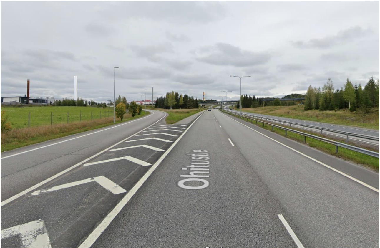
Pulonin näkyvyys ohitustien liittymän kohdalta, pyloni näkyy valkoisella.