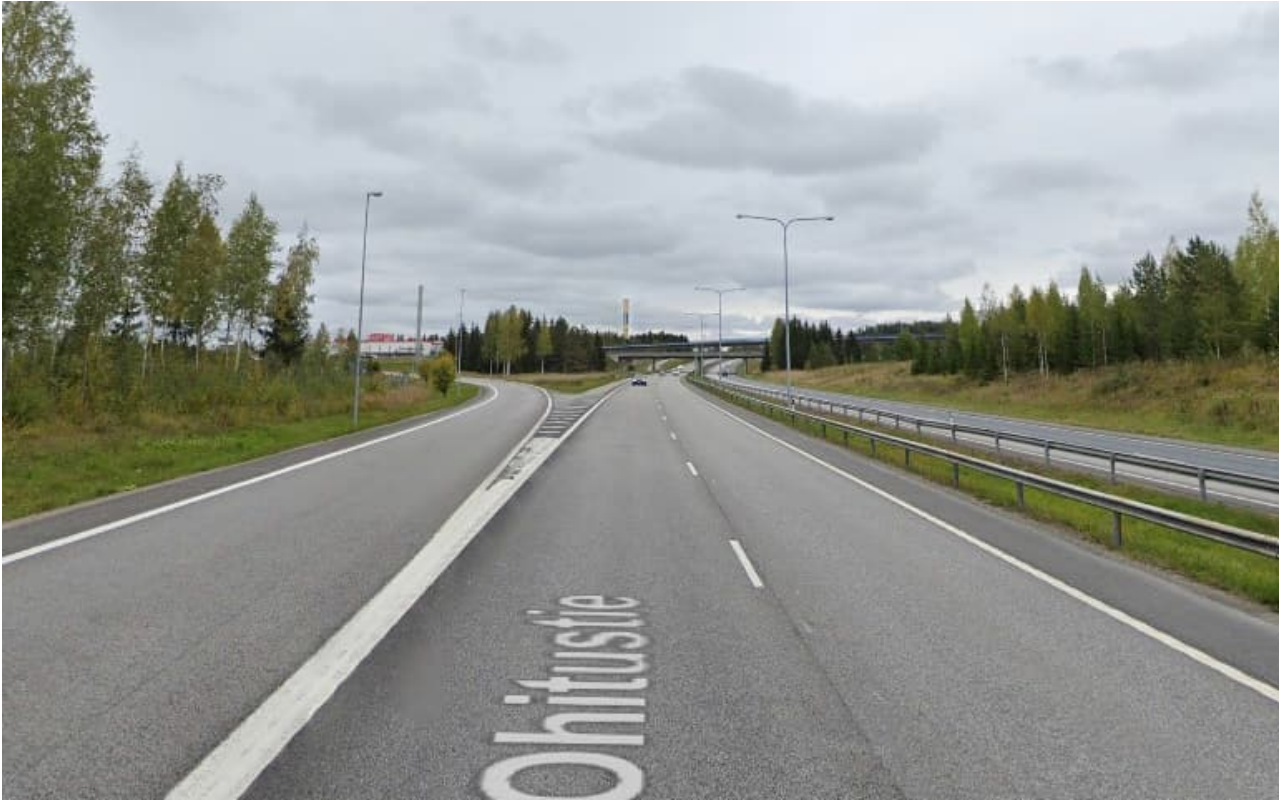
Näkyvyys Luhdan tornin ja liittymän puolivälistä.