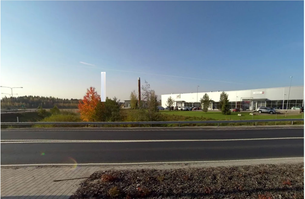
karkea havainnekuva pylonista, korkeus pari metriä korkeampana, kuin voimalaitoksen piippu (ABC:n pylonin korkeus)