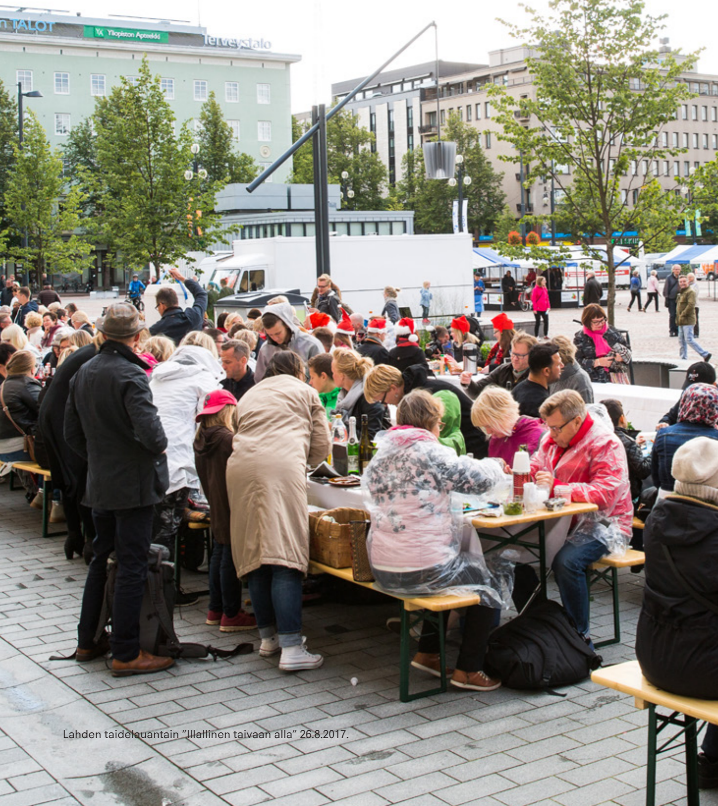
Lahden taidelauntain "Ihminen taivaan alla" 26.8.2017.