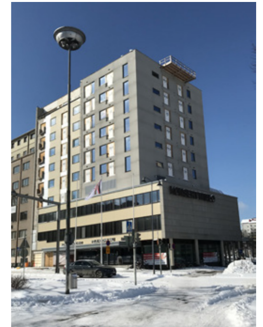
Konserttitalon keskeneräiseksi jäänyttä torniosaa voidaan pitää rakenteellisen korruption muistomerkkinä.

Konserttitalon asunto-osan rakentaminen on ollut keskeytyksissä yli kaksi vuotta rakennuttajan rahoitusvaikeuksien vuoksi. Maaliskuussa 2018 rakennuttajayhtiö asetettiin konkurssiin. Rakennushanke jatkuu mahdollisesti aikanaan uuden rakentajan toimesta, sikäli kun joku uskaltaa jatkaa pitkään sään armoilla keskeneräisenä ollutta rakennushanketta.