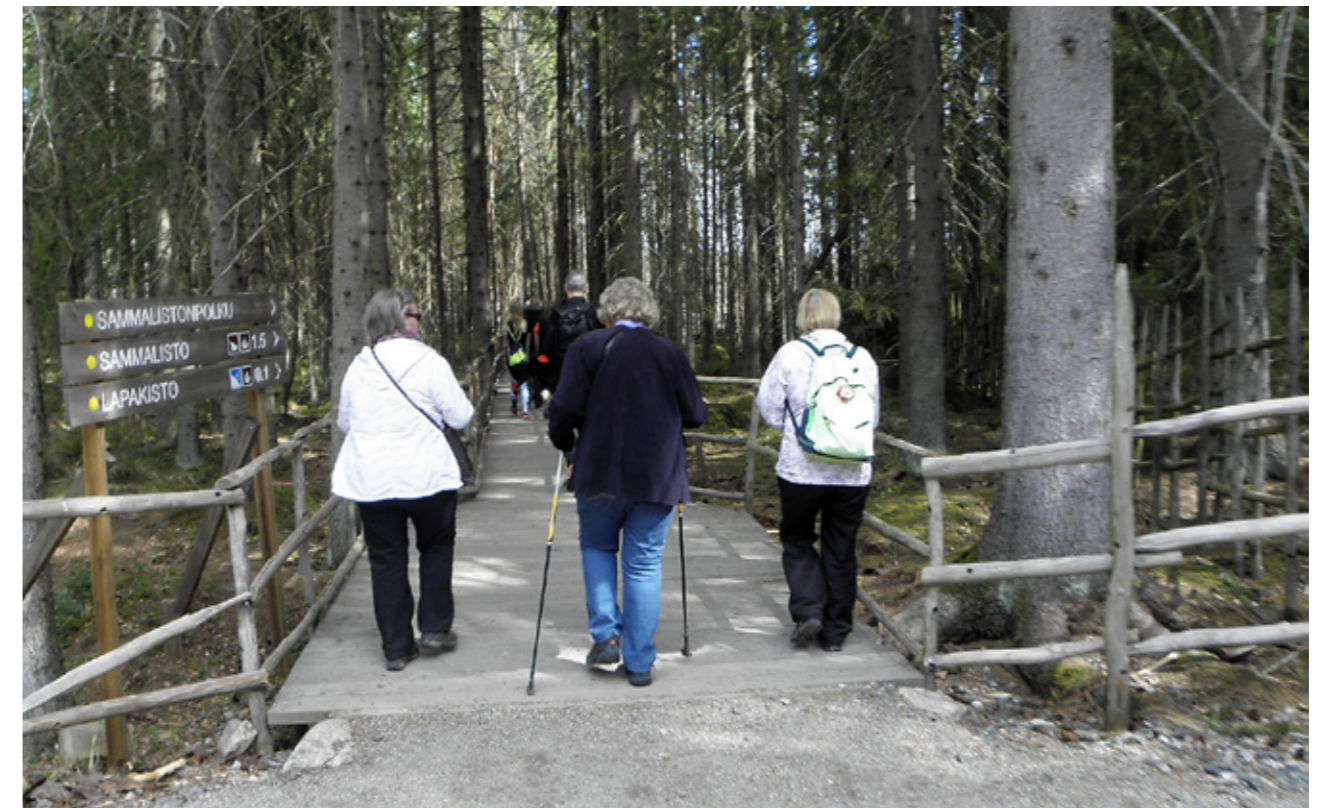
Lapakiston retkeilyalueella on helppo liikkua.