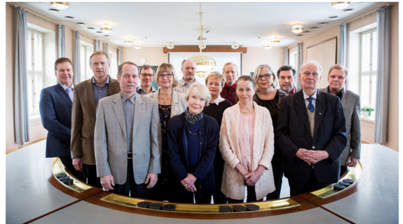
Tarkastuslautakunta kokouksessaan 21.3.2018 kaupunginhallituksen kokoushuoneessa kaupungintalolla

Vuonna 2017 valtuuston toimikauden alkaminen siirtyi kesäkuun alkuun, kun aiemmin toimikausi alkoi vuoden alussa. Tällä on vaikutusta tarkastuslautakunnan esteellisyyksiin, koska 1.6.2017 toimikautensa aloittanut lautakunta arvioi koko vuoden 2017 toimintaa. Esteellisyys vuoden 2017 arviointiin koskee sekä 31.5.2017 päättyneitä että 1.6.2017 alkaneita kaupungin ja kaupunkikonsernin luottamustoimia. Liitteenä 1 on selvitys esteellisyyksistä arviointikertomuksen laadinnassa.