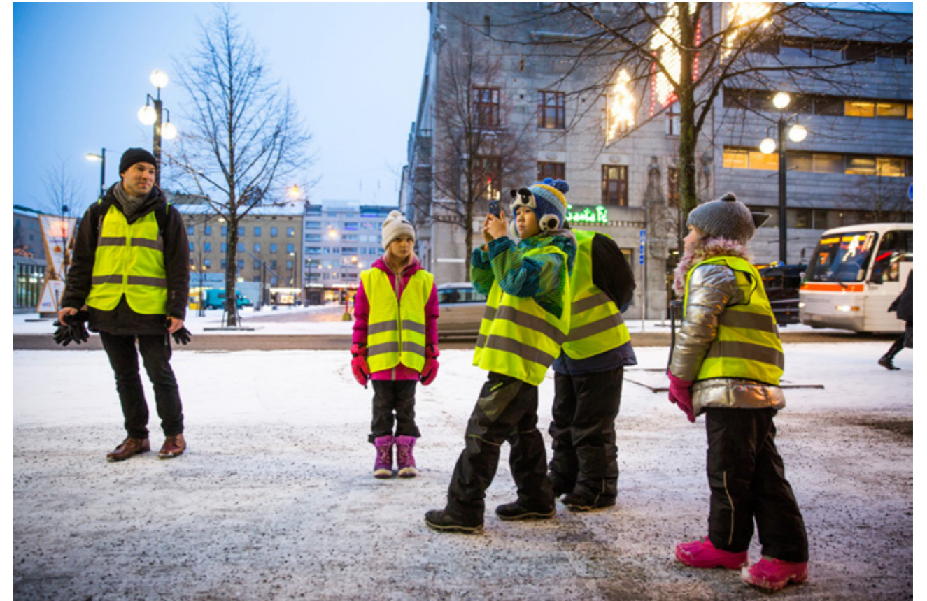
Lapset auditoivat uusittua Aleksanterinkatua.

Pohjaveden kemiallista tilaa ovat heikentäneet etenkin vanhat torjunta-ainejäämät, kloridi, liuotinaiset ja bensiinin lisäaineet. Pohjaveden laatu on kuitenkin varsin hyvä. Historiallinen Launeen vedenottamo päästiin jälleen ottamaan käyttöön 15 vuoden tauon jälkeen, kun torjunta-ainejäämistä ei ollut enää havaintoja. Pohjavesien laatuun odotetaan jatkossa myönteistä vaikutusta myös siitä, kun katu- ja liukkaudentorjunnassa on siirrytty suolasta ympäristöstävällisempiin aineisiin.