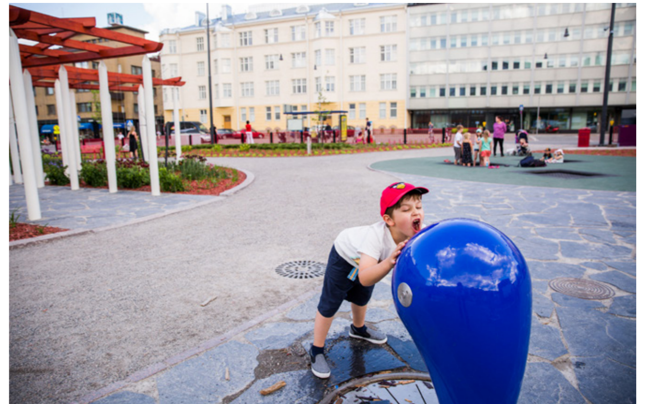
Vesipiste uusittu alatorilla.

Ympäristön tilan kehitystä kuvaamaan valitut strategiset mittarit ovat sellaisia, ettei niiden vuosittainen mittaaminen ole mahdollista eikä tarkoituksenmukaistakaan.