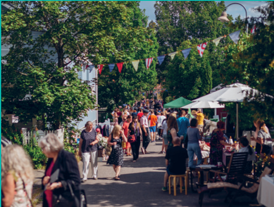
Päijät-Hämeen vuoden kyläksi 2020 valittiin Anttilanmäki. Alueella toimii ja vaikuttaa aktiivinen Anttilanmäki-Kittelän asukasyhdistys ry. Kuva Anttilanmäen kyläjuhlista.