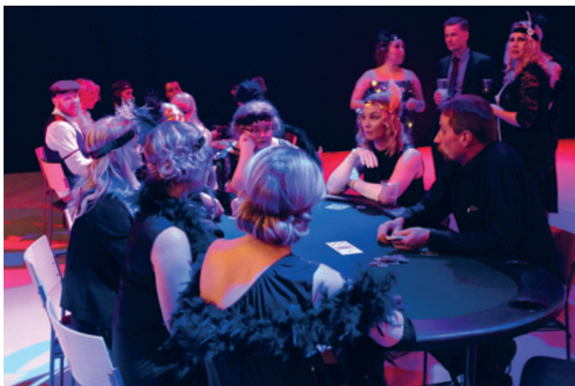
Kaupungin työntekijöiden yhteiset pikkujoulujuhlat "Lahen bileet" järjestettiin toista kertaa 5.12.2019

Henkilöstöasiat olivat tarkastuslautakunnan arviointikokouksen aiheena joulukuussa 2019. Tällöin henkilöstöjohto kertoi tavoitteena olevan, että Lahden kaupungista tehdään Suomen paras työpaikka. Lautakunnan mielestä tähän on vielä pitkä matka. Esimiestyössä, henkilöstön palkkaustavoissa, urakehitysmahdollisuuksissa, palkitsemisessa ja sijaisjärjestelyissä on vielä paljon kehitettävää.