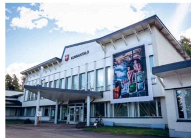
Nastolan kunnantalon kesänäyttely 2019.

Tarkastuslautakunta toteaa, että yhdistymisavustuksen käyttötarkoitus on ollut väljä. Tämä on mahdollistanut avustuksen monenlaisen käytön etenkin, kun avustuksen käytöstä ei ole ollut selkeää suunnitelmaa.