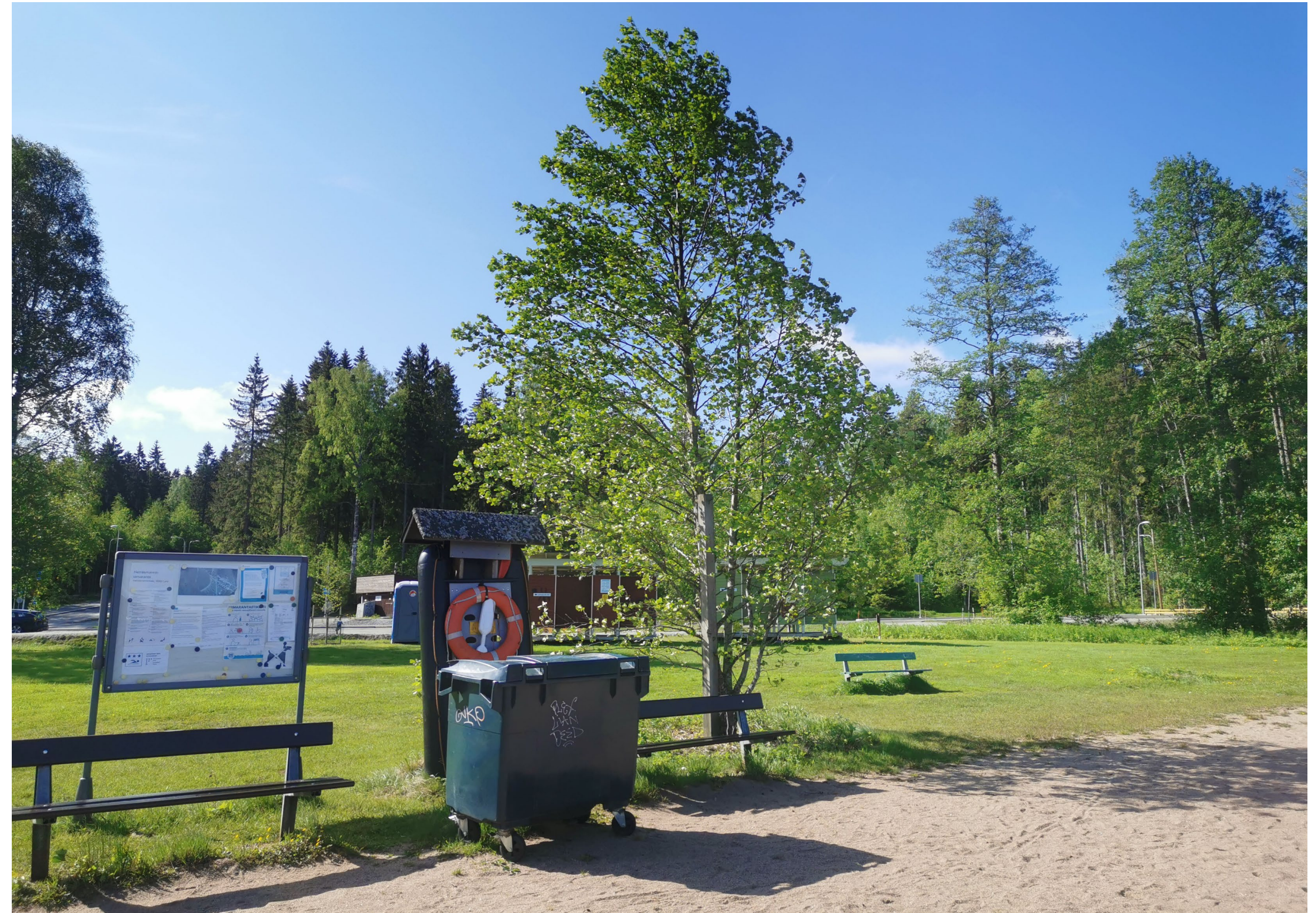
Nykyisiä penkkejä, roskaa-astia, infotaulu ja pelastusrengas.