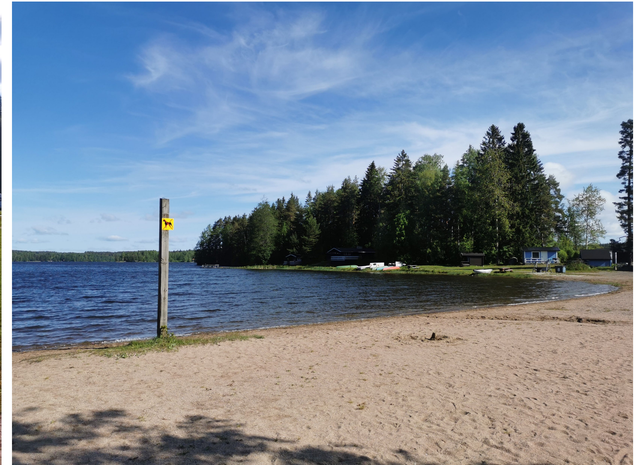
Rantahiekkaa ja koirakieltokyltti.