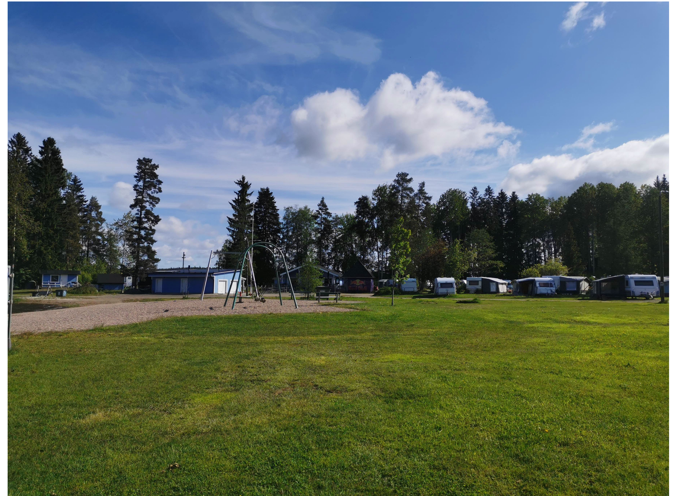
Aurinkonurmi uimarannan ja leirintäalueen välissä.