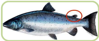
Järvilohi (aina leikattu rasvaevä)