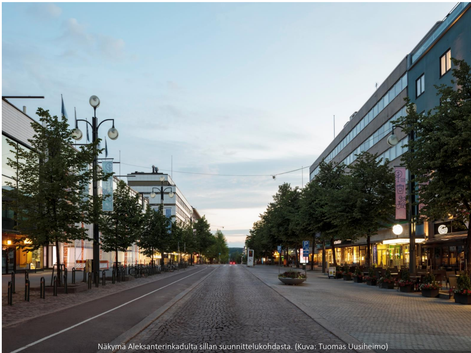
Näkymä Aleksanterinkadulta sillan suunnittelukohtasta.