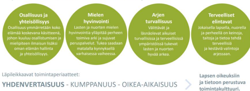
Kuva 2. Lasten ja nuorten hyvinvointisuunnitelmat painopistealueet Lahdessa 2022-2025