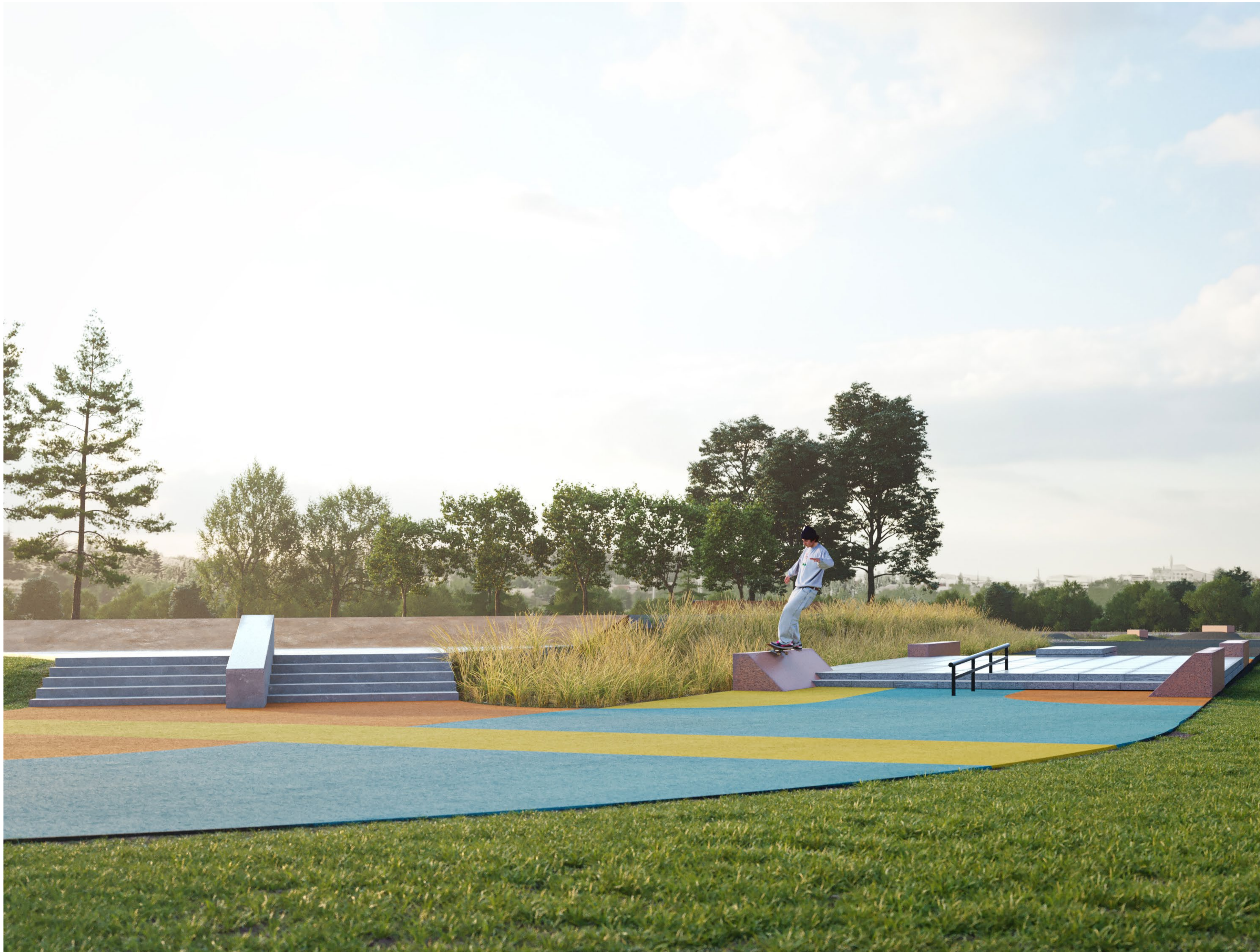
NÄKYMÄ SKATEPATHIN LUOTEISKULMASTA KOHTI ETELÄÄ Skatepathin betoniset rakenteet päällystetään nykyiseltä skeittiparkilta kierrätettävillä graniittilaatoilla. Asfaltoitu flättialue pinnoitetaan plexipave-maalilla.