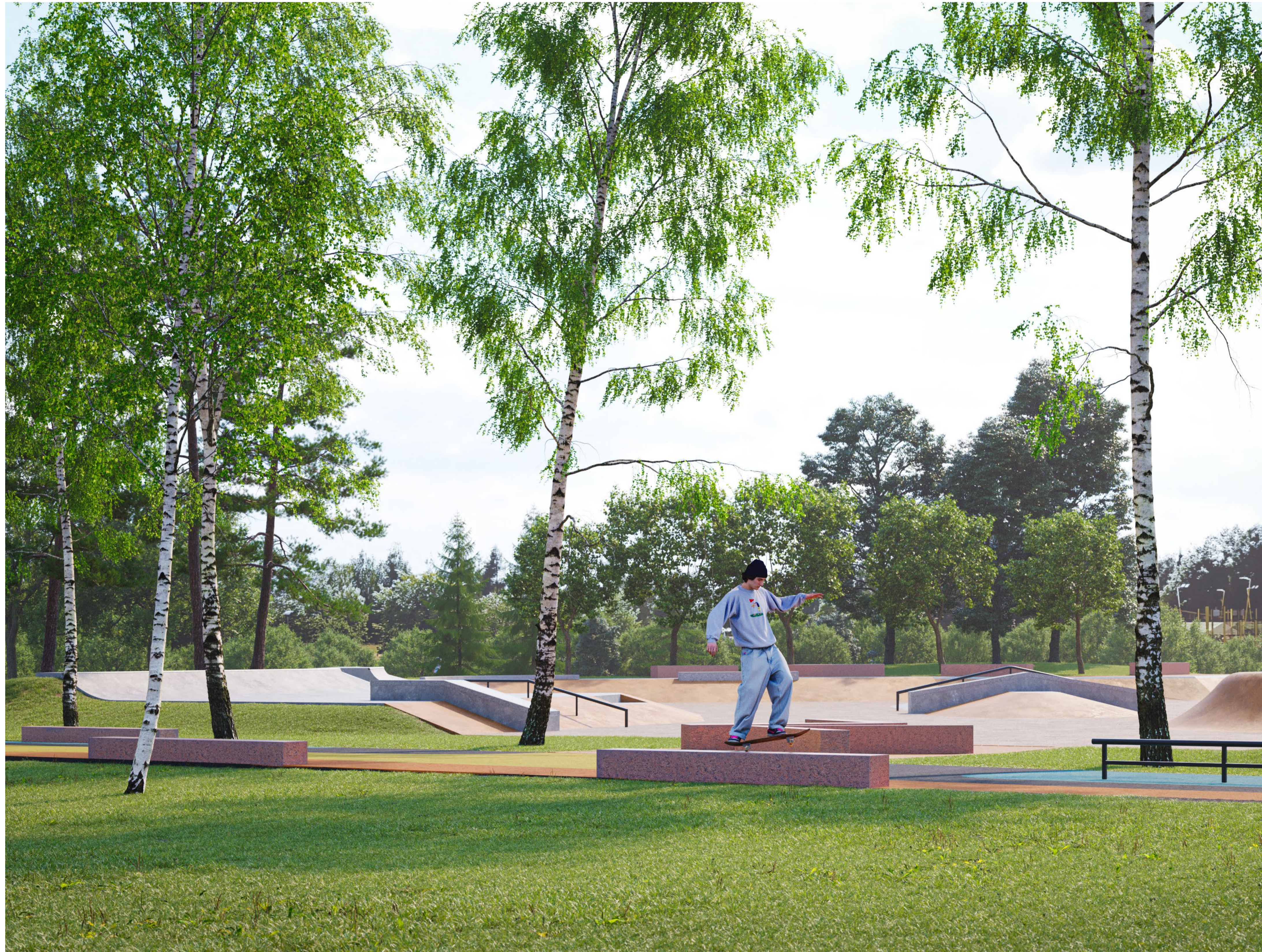
NÄKYMÄ SKATEPATHIN POHOJISELTA STREET-ALUEELTA TAPAHTUMAKENTÄN SUUNNASTA Taustalla näkyy skeittiparkki, missä parkin elementit on valettu betonista ja flättialue on komposiittiasfalttia.