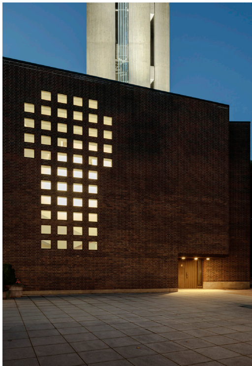
Ristinkirkko 1978 Alvar Aalto Elissa Aalto