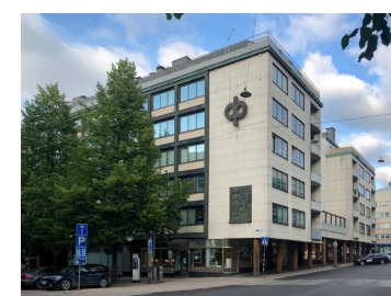
7 Rahatalo 1956 Unto Ojonen