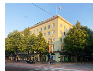
6 Fagerholmintalo 1928 Jussi & Toivo Paatela