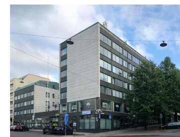
9 Paasinkulma 1959 Unto Ojonen