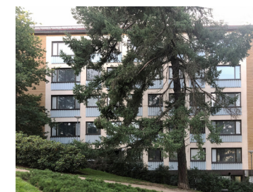
14 Mariankatu 2 1955 Unto Ojonen