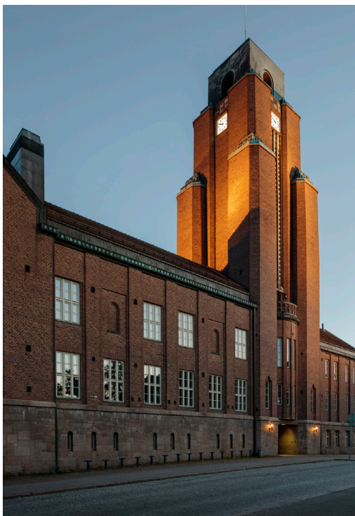
Lahten kaupungintalo 1912 Eliel Saarinen

Omien mäkiensä päälle sijoittuvat kaksi tornia ovat suunnitelleet Suomen kansainvälisesti tunnetuimmat arkkitehdit. Akselin pohjoispäässä sijaitsee Alvar Aallon 1978 valmistunut Ristinkirkko ja Eteläpäässä 1912 valmistunut Eliel Saarisen kaupungintalo.