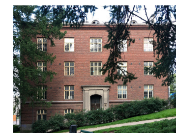
15 Janhusen talo 1927 Georg Wigström