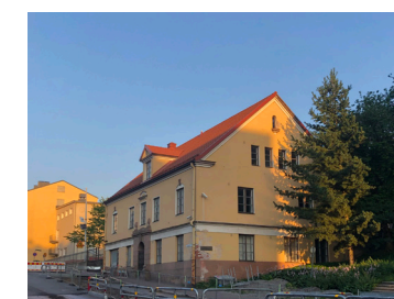
13 Millerin talo 1926 Runar Eklund