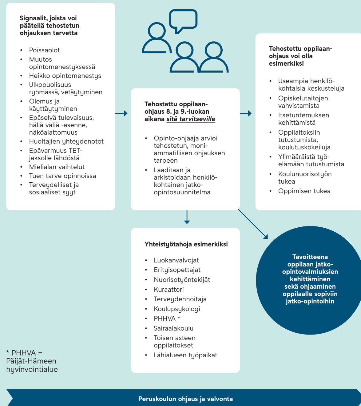
KAAVIO 1. Tehostettu henkilökohtainen ohjaus (muokattu Säkkinen-Salminen 2021 kaavion pohjalta)