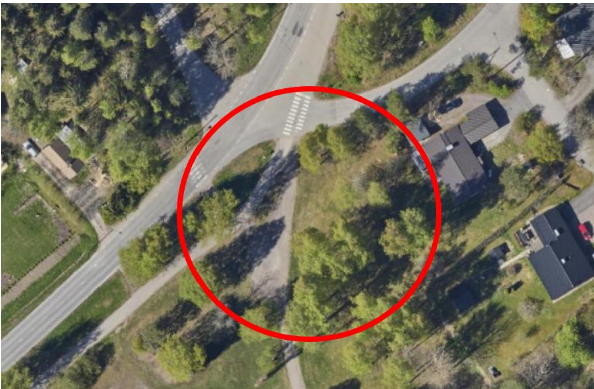
Suunnittelualue, ilmakuva 2022