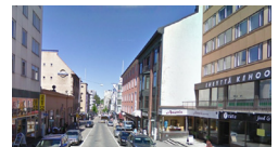
Rautatienkatu 13:n seinä.