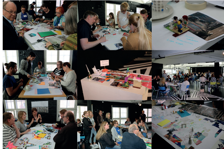
Kuvia 14.6.2017 pidetystä työpajasta.

Seuraava tarina perustuu 14.6. 2017 pidettyyn työpajaan osallistuneiden ideoihin Rautatienkadun tulevaisuudesta. Sen tarkoituksena on inspiroida mutta ei rajoittaa taiteilijoiden ideointityötä.