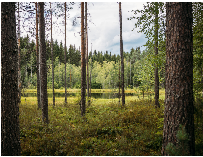
Suorantainen Kintterönlampi on muodostunut suppaan.